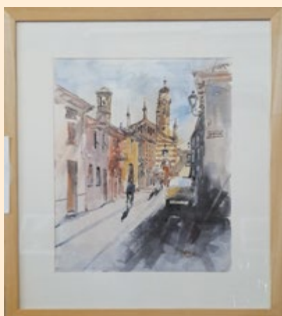
Bracco Giorgio - Via Valente