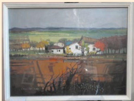
Cacciatori Idalio - Dintorni di Quargento