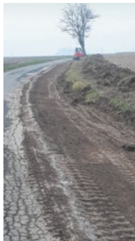
Strada Ballestrero (ripristino tratto di fosso)

Presidente Consorzio Unico Strade Consortili