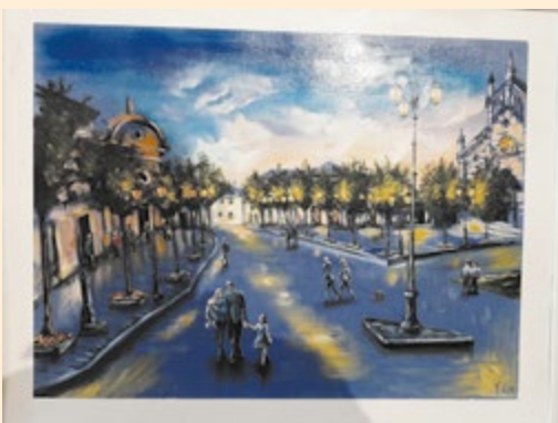
Gariboldi Floriana - La luce incontra il colore