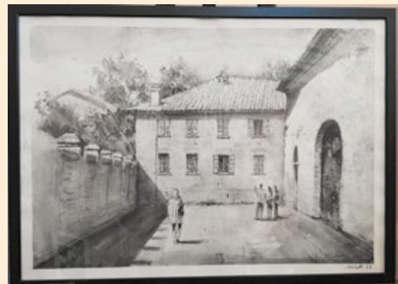
Santi Stefano - Quargento ... una volta