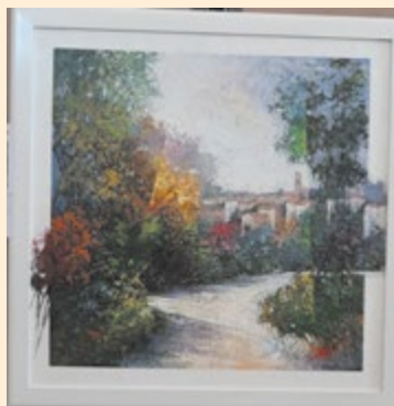
Augelli Angelo - La strada dei ricordi