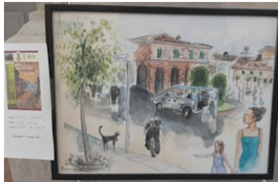
Psiche Zanca - Il gatto a strisce