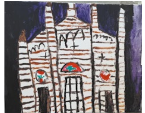
Spadaro Stella - La Basilica di Quargento vista da me