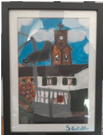
Castello Sofia - Casa mia